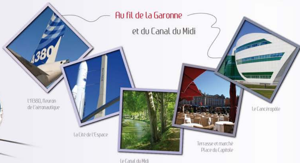
L'A380, fleuron de l'aéronautique