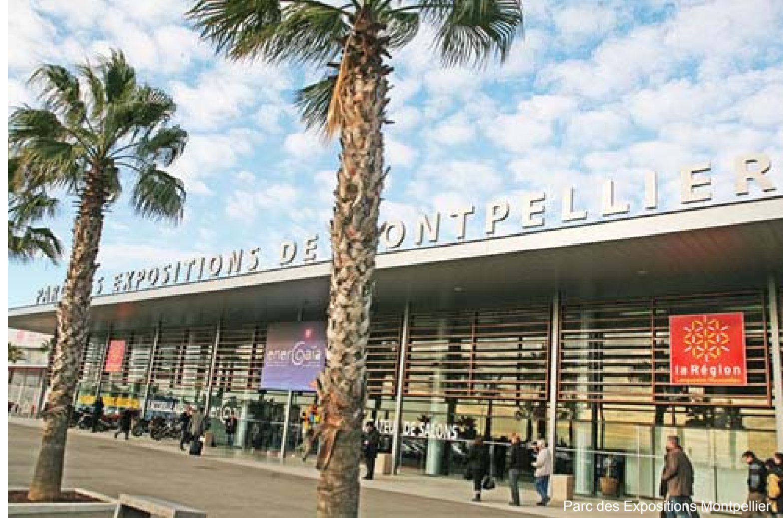
Parc des Expositions Montpellier